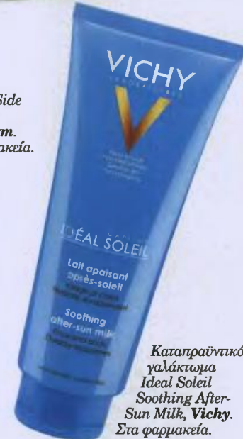
Καταπραϊντικό γαλάκτωμα Ideal Soleil Soothing After-Sun Milk, Vichy. Στα φαρμακεία.