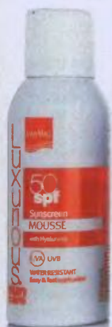
Αντηλιακό σε μορφή μους Luxuriously Sunscreen Mousse SPF 50. Στα φαρμακεία από την InterMed.

Το πιο σημαντικό στη σωστή χρήση του αντηλιακού είναι η εφαρμογή του. Φροντίστε να καλύψετε όλη την επιφάνεια του δέρματος και όχι μόνο το μέρος που εκτίθεται στον ήλιο.