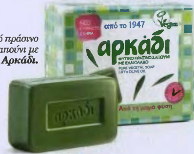
Φυτικό πράσινο σαπούνι με ελαιόλαδο, Αρκάδι.