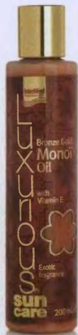
Ενυδατικό έλαιο με λάμψη Luxuriously Bronze Gold Monoi Oil. Στα φαρμακεία από την InterMed.