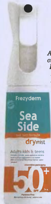
Αντηλιακό σπρέι Sea Side Dry Mist, Frezyderm. Στα φαρμακεία.