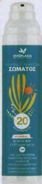
Αντηλιακό γαλάκτωμα με χρυσό φύκι SPF 20, αναPLASIS. Στα φαρμακεία και στο anaplasis.gr