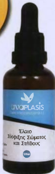
Έλαιο σύσφιξης για το σώμα και το στήθος, anaPLASIS . Στα φαρμακεία και στο anaplasis.gr