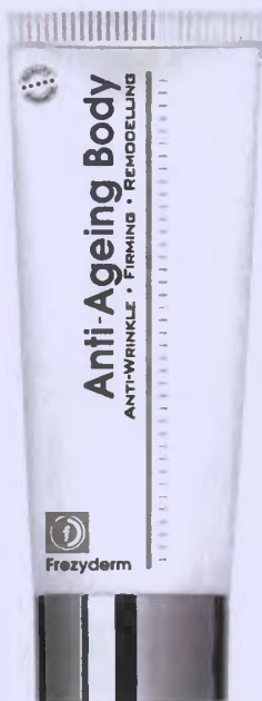
Αντιγηραντική κρέμα Anti-Ageing Body , Frezyderm.

Για άμεσα αποιελέσματα συνδυάστε τη σωστή διατροφή με την άσκηση, ενώ μην παραλείψετε τη οξολαστική φροντίδα του δέρματος.