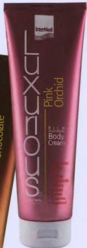
Ενυδατική κρέμα σώματος Luxurious Pink Orchid Body Cream . Στα φαρμακεία από την InterMed.