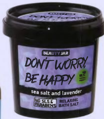
Άλατα μάνιου για χαλάρωση Don't Worry Bey Happy , Beauty Jar , efrontida.gr