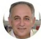
Γράφει ο ΓΕΡΑΣΗΣ ΠΑΠΑΜΙΧΑΗΛ