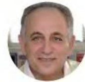
Γράφει ο ΘΑΝΑΣΗΣ ΠΑΠΑΝΙΚΟΛΑΟΥ

Από τη Δευτέρα 14 Ιουνίου έως και την Κυριακή 25 Ιουλίου, οι πελάτες της Lidl Ελλάς που είναι χρήστες του Lidl Plus , συγκεντρώνουν « Στάμπες Lidl Plus » και διεκδικούν 1 αυτοκίνητο Mini Countryman και πολλά ακόμα μοναδικά δώρα. Με έναν μοναδικό διαγωνισμό εγκαινιάζει η Lidl Ελλάς τη νέα λειτουργία « Στάμπες Lidl Plus » και διεκδικούν 1 αυτοκίνητο Mini Countryman και πολλά ακόμα μοναδικά δώρα. Με έναν μοναδικό διαγωνισμό εγκαινιάζει η Lidl Ελλάς τη νέα λειτουργία « Στάμπες Lidl Plus » του βραβευμένου προγράμματος πιστότητας πελατών Lidl Plus. Σκανάροντας την ψηφιακή τους κάρτα Lidl Plus στο ταμείο και με αγορές από 5 ευρώ και πάνω, οι πελάτες λαμβάνουν 1 στάμπα εντός της εφαρμογής. Με κάθε 5 στάμπες συγκεντρώνουν 1 συμμετοχή στην κλήρωση, που θα πραγματοποιηθεί στο τέλος του διαγωνισμού. Οι συμμετοχές αποστέλλονται ηλεκτρονικά από τους ίδιους τους χρήστες μέσω της εφαρμογής Lidl Plus, ενώ η εφαρμογή υπολογίζει αυτόματα και με ακρίβεια τις στάμπες που αναλογούν σε κάθε πελάτη, μετά τις αγορές του. Βάσει νομοθεσίας, εξαιρούνται συγκεκριμένα προϊόντα και ισχύουν όροι και προϋποθέσεις.